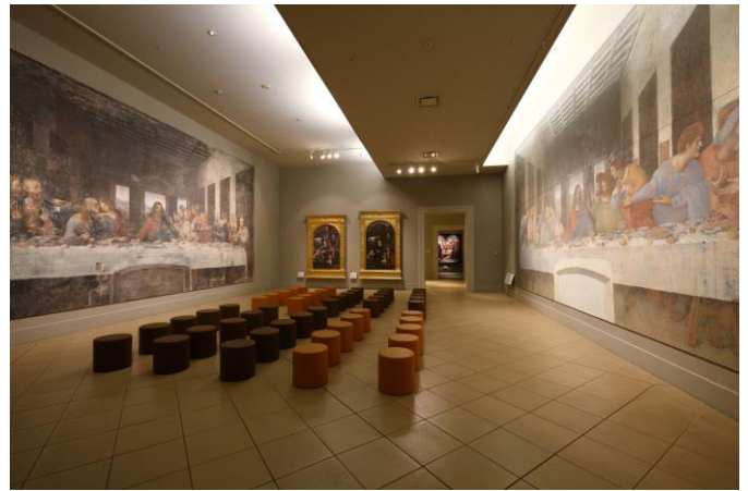
「最後の晩餐〈修復前〉〈修復後〉」