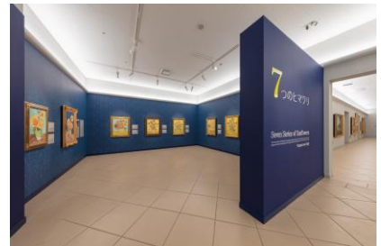
大塚国際美術館開館20周年記念! ゴッホの花瓶の「ヒマワリ」全7点を常設展示

その他、オリジナル作品と同じ大きさに再現された2000年以上色褪せない、迫力の西洋名画約1000点を鑑賞。