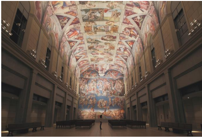
「システィーナ・ホール」